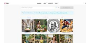
Clio AI image maker